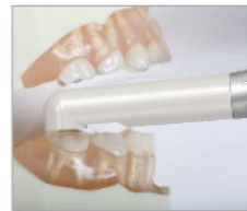
Der schmale Kopf erreicht auch distale Zahnflächen